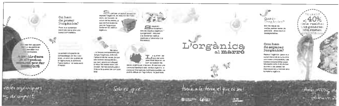
Imatge del quadríptic a editar per als habitatges dels nou municipis

Consorci per a la Gestió dels Residus Municipals de les Comarques de la Ribera d'Ebre, el Priorat i la Terra Alta