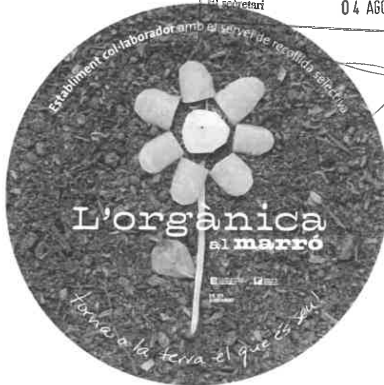
Imatge corresponent al distintiu per a grans productors.